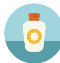
odpady płynne nierozpuszczalne w wodzie