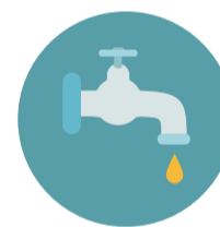
wody drenażowe i deszczowe