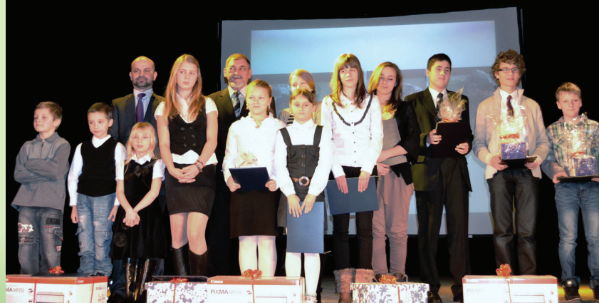
Uroczyste wręczenie nagród laureatom konkursu plastyczno-fotograficznego

Związek Międzygminny ds. Ekologii we wrześniu 2011 r. ogłosił konkurs fotograficzno-plastyczny pod hasłem „Czysta woda, gleba i powietrze – szansą na zachowanie pięknej przyrody wokół nas”, dla uczniów Szkół Podstawowych oraz Gimnazjów z terenu jedenastu gmin realizujących Projekt „Oczyszczanie ścieków na Żywiecczyźnie – Faza II”. Na konkurs wpłynęło 591 prac, w tym 83 fotografie. Oceny prac dokonała komisja konkursowa, która brała pod uwagę kryteria merytoryczne, wartość artystyczną, jakość, technikę i poziom estetyczny prac.