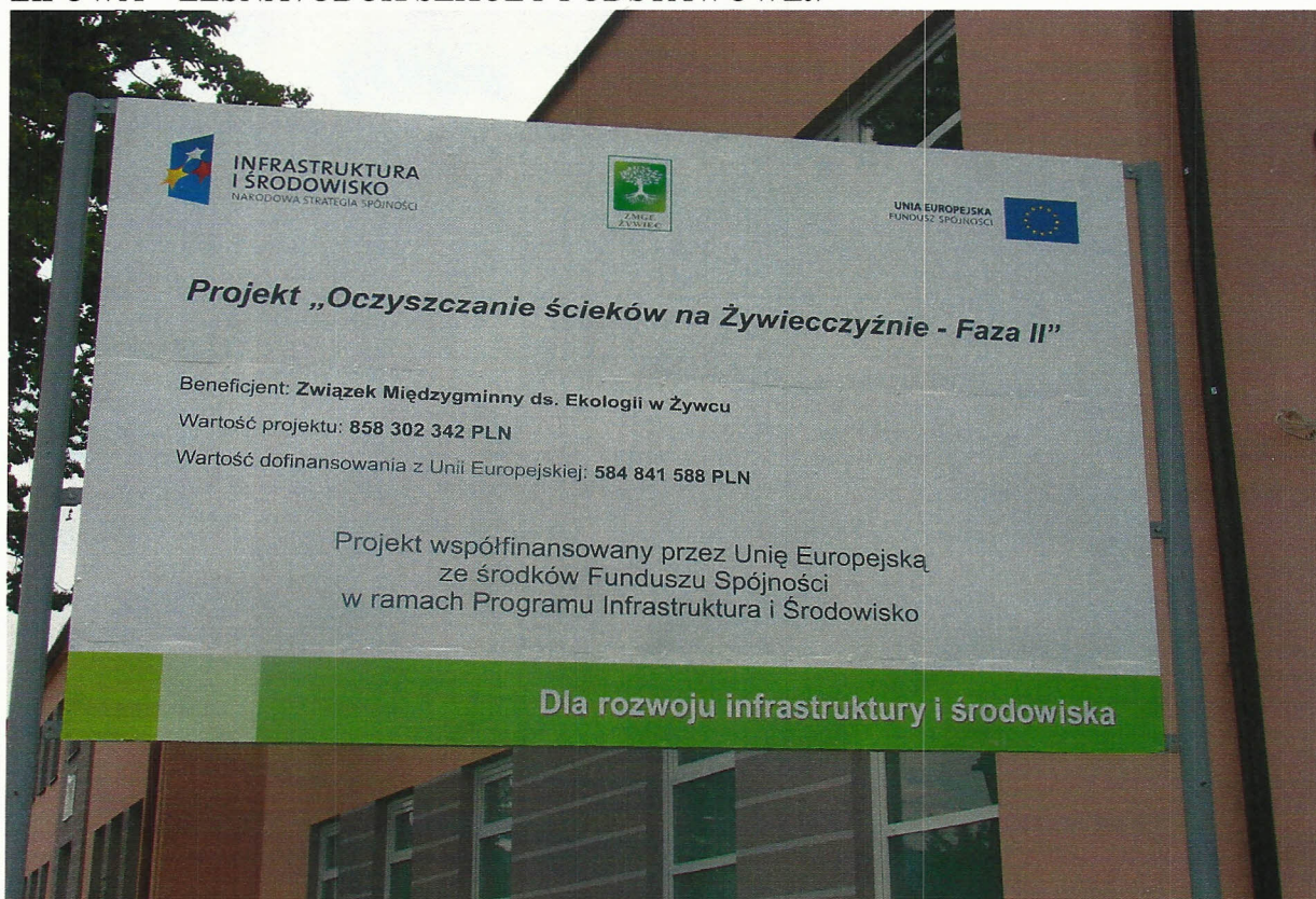
TABLICA NR 2 – PERSPEKTYWA DALSZA LIPOWA – LEŚNA /OBOK SZKOŁY PODSTAWOWEJ/