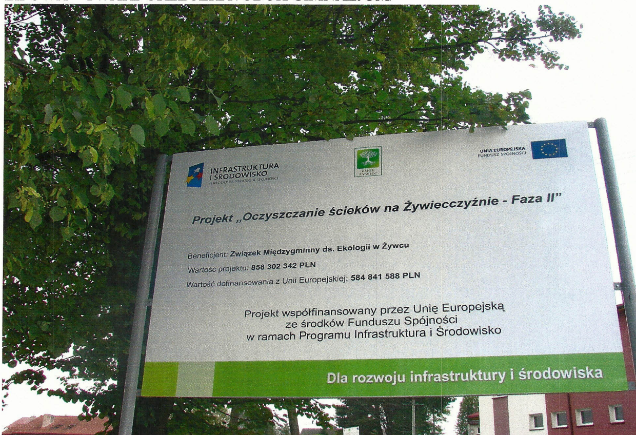
TABLICA NR 1 – PERSPEKTYWA BLIŻSZA LIPOWA – TWARDORZECZKA /OBOK GIMNAZJUM/