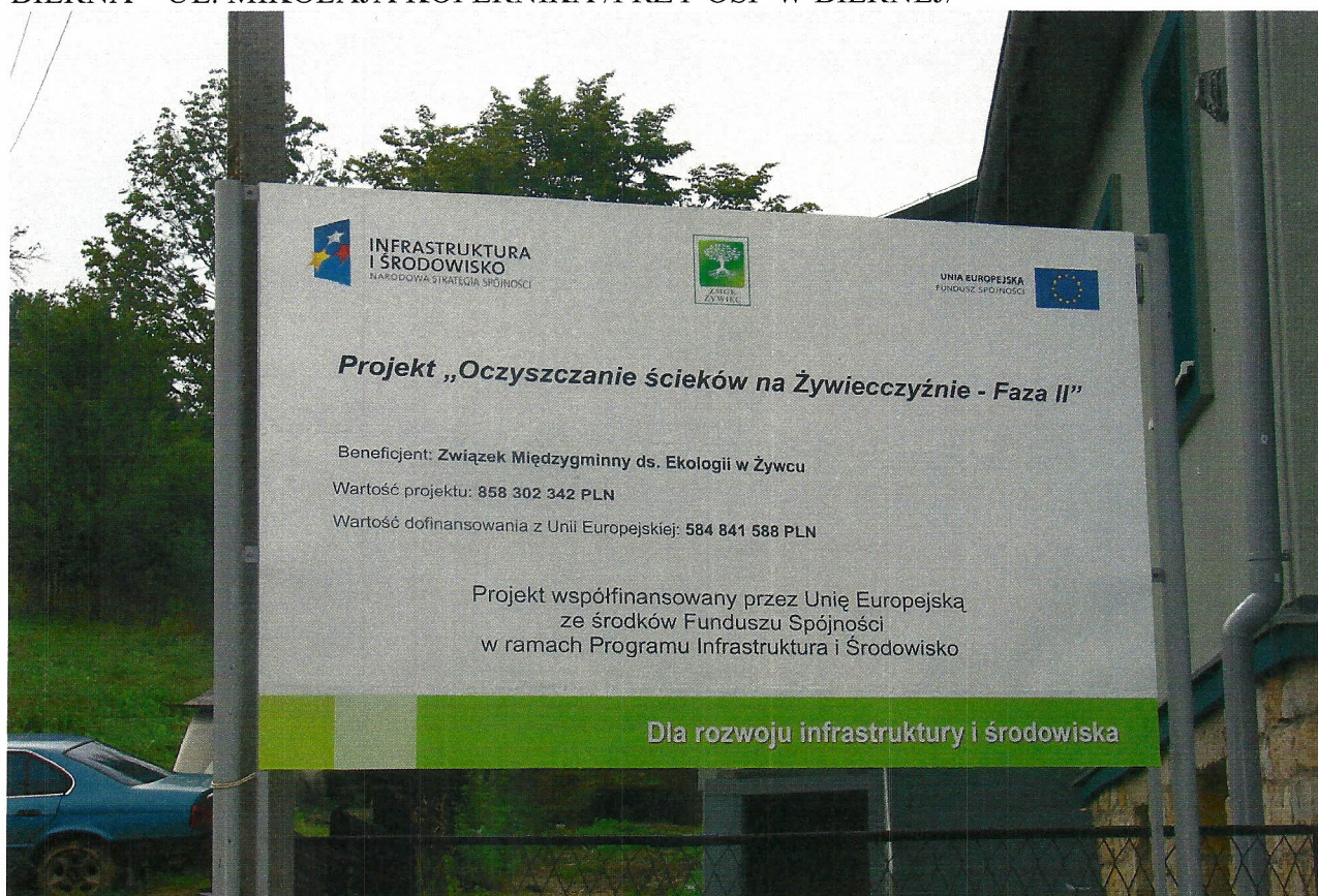
TABLICA NR 3 – PERSPEKTYWA DAŁSZA BIERNA – UL. MIKOŁAJA KOPERNIKA /PRZY OSP W BIERNEJ/