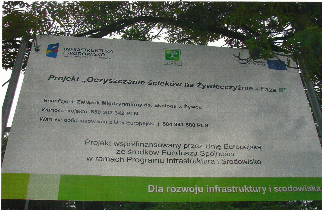
TABLICA NR 1 – PERSPEKTYWA DALSZA ŁODYGOWICE – UL. PIŁSUDSKIEGO /OBOK URZĘDU GMINY/