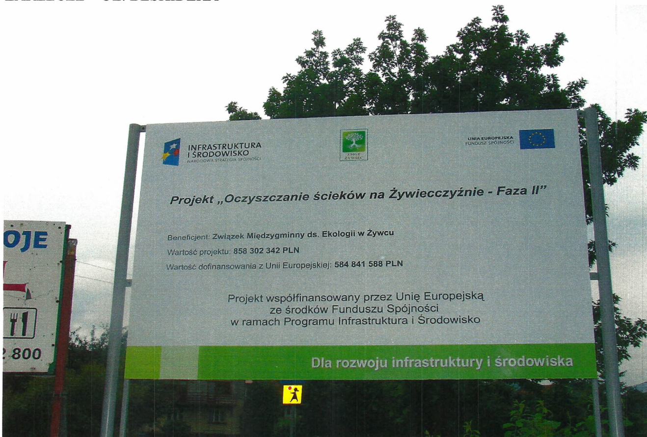
TABLICA NR 4 – PERSPEKTYWA DALSZA ZARZECZE – UL. BESKIDZKA