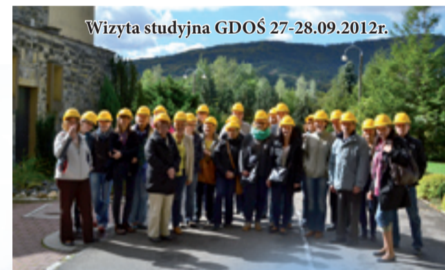
Wizyta studyjna GDOS 27-28.09.2012r.