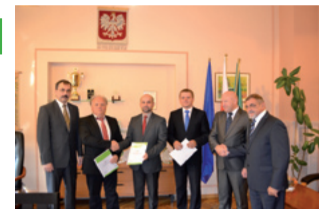
Podpisanie umowy w Milówce

Wykonawcą robót zostało Przedsiębiorstwo Budownictwa Inżynierskiego „MACHNIK” z Mochnaczki Wyżnej, a wartość kontraktu wynosi: 72 985 552, 43 zł brutto.