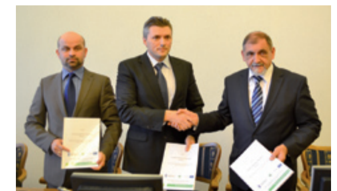
Podpisanie umowy w Żywcu

Kontrakt zakłada również budowę sieci kanalizacji sanitarnej – Kolektor nad Markiem, budowę sieci kanalizacji sanitarnej wraz z przyłączami domowymi w dzielnicy Moszczanica w Żywcu – rejon ul. Asnyka, zbiornik wody pitnej Leśniaka wraz z modernizacją istniejących zbiorników i hydrofoni oraz budowę sieci kanalizacji sanitarnej – syfon (przekroczenie Koszarawy).