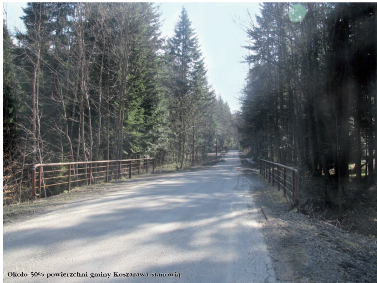
Okolo 50% powierzchni gminy Koszarawa stanowią

„Okolo 50 % powierzchni Gminy Koszarawa stanowią lasy. Brak przemysłu jest gwarancją czystego górskiego powietrza oraz czystej wody w Koszarawie i jej dopływach. Tutejsi mieszkańcy trudnią się uprawą ziemi, hodowlą i chałupnictwem. Na terenie Gminy Koszarawa nie występują duże podmioty gospodarcze. Istnieje szereg mniejszych przedsiębiorstw i osób fizycznych prowadzących działalność gospodarczą w zakresie przede wszystkim przerobu drewna, usług leśnych, usług transportowych oraz usług remontowo-budowlanych. Dynamicznie rozwija się również zaplecze turystyczne przede wszystkim w zakresie gospodarstw agroturystycznych” – czytamy na stronie internetowej Gminy Koszarawa. Z Koszarawy rozciąga się piękny widok na pasmo Babiej Góry.