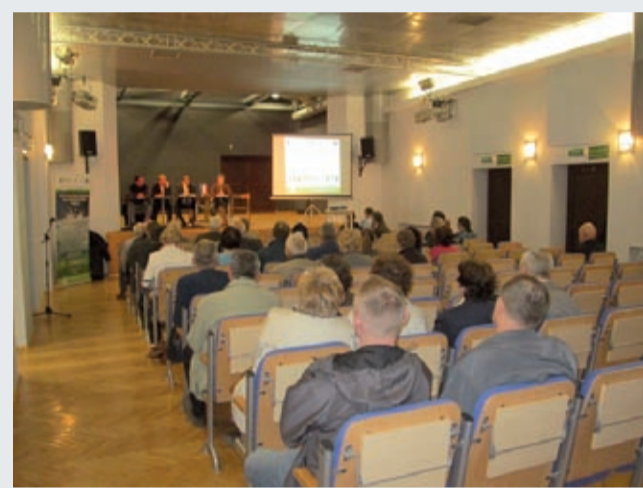
Żywiec - Sporysz