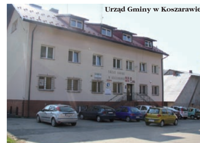
Urząd Gminy w Koszarawie

Dziś, kiedy zabawka ludowa odchodzi powoli w zapomnienie, w Koszarawie stawiają na nowe technologie. Gmina bierze udział w projekcie unijnym „Informatyzacja Urzędu Gminy w Koszarawie”, zaś mieszkańcy uczestniczą w programie „Rozwój Internetu w Gminie Koszarawa szansą dla wykluczonych cyfrowo mieszkańców”. Koszarawa działa zatem perspektywicznie, szanując jednak własną historię i zwyczaje.