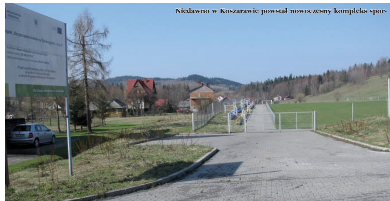
Niedawno w Koszarawie powstał nowoczesny kompleks spor-

Koszarawa to świetne miejsce wypadowe, do pie-