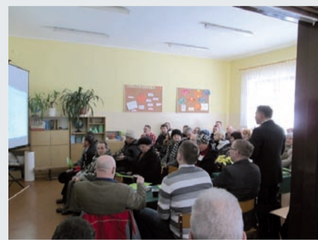
Ujsoly - Sobłówka

związane z budową sieci kanalizacyjnej i wodociągowej, co może być pomocne w prowadzeniu i planowaniu dalszych robót. Dlatego też, dzięki tym spotkaniom, nie tylko mieszkańcy mają okazję uzyskać bardziej szczegółowe informacje na temat przedsięwzięcia, ale także instytucje bezpośrednio odpowiedzialne za realizację tego Projektu mają szansę zdefiniować istotne problemy związane z inwestycją. Zachęcamy do udziału w spotkaniach, a informacje o kolejnych będą na bieżąco zamieszczane na stronie internetowej Związku – www.zmgz.zywiec.pl (zakładka: Spotkania z mieszkańcami).