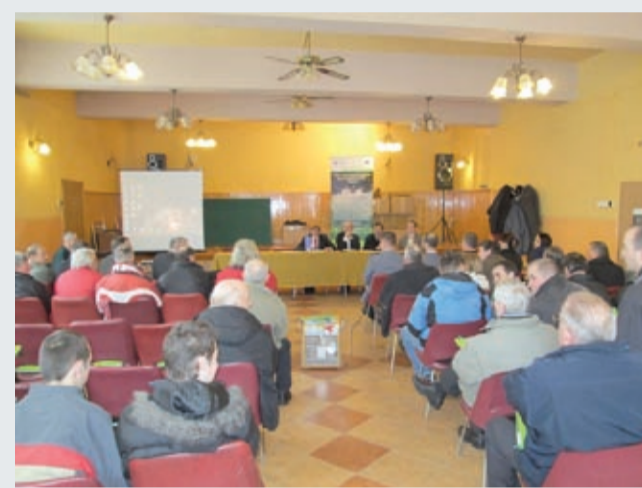
Żywiec - Moszczanica