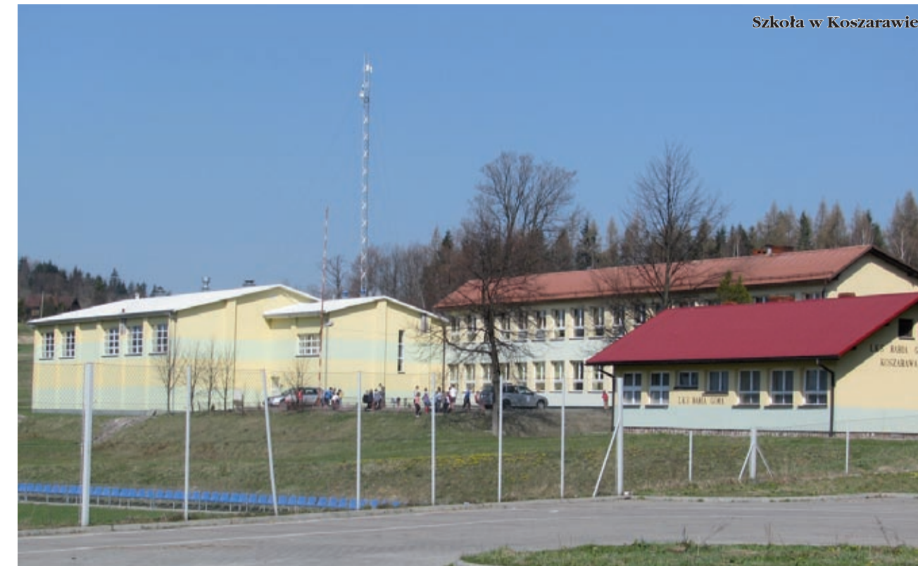
Szkoła w Koszarawie