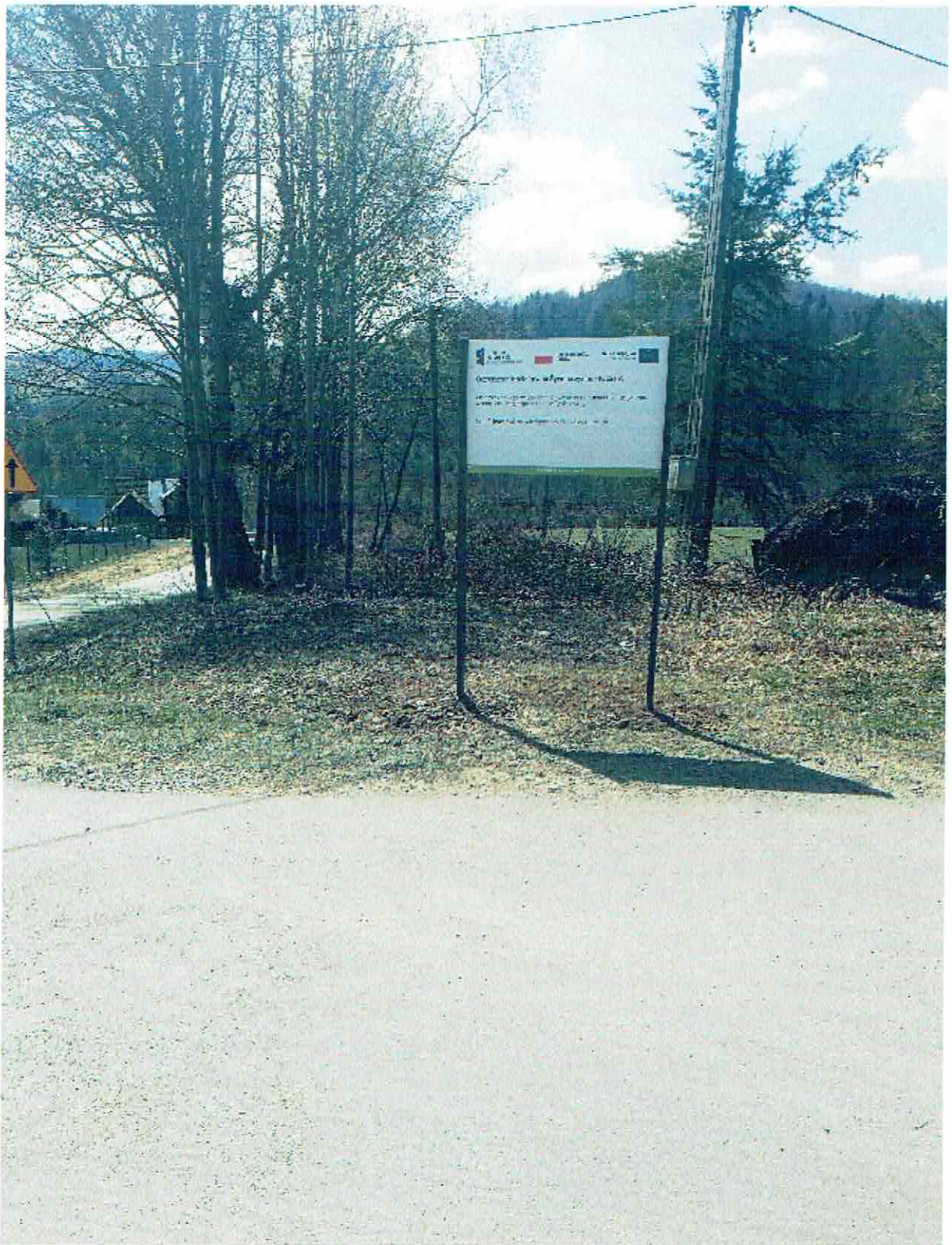
Tablica nr 1 Milówka - Kamesznica ul. Dworkowa (obok Cmentarza)