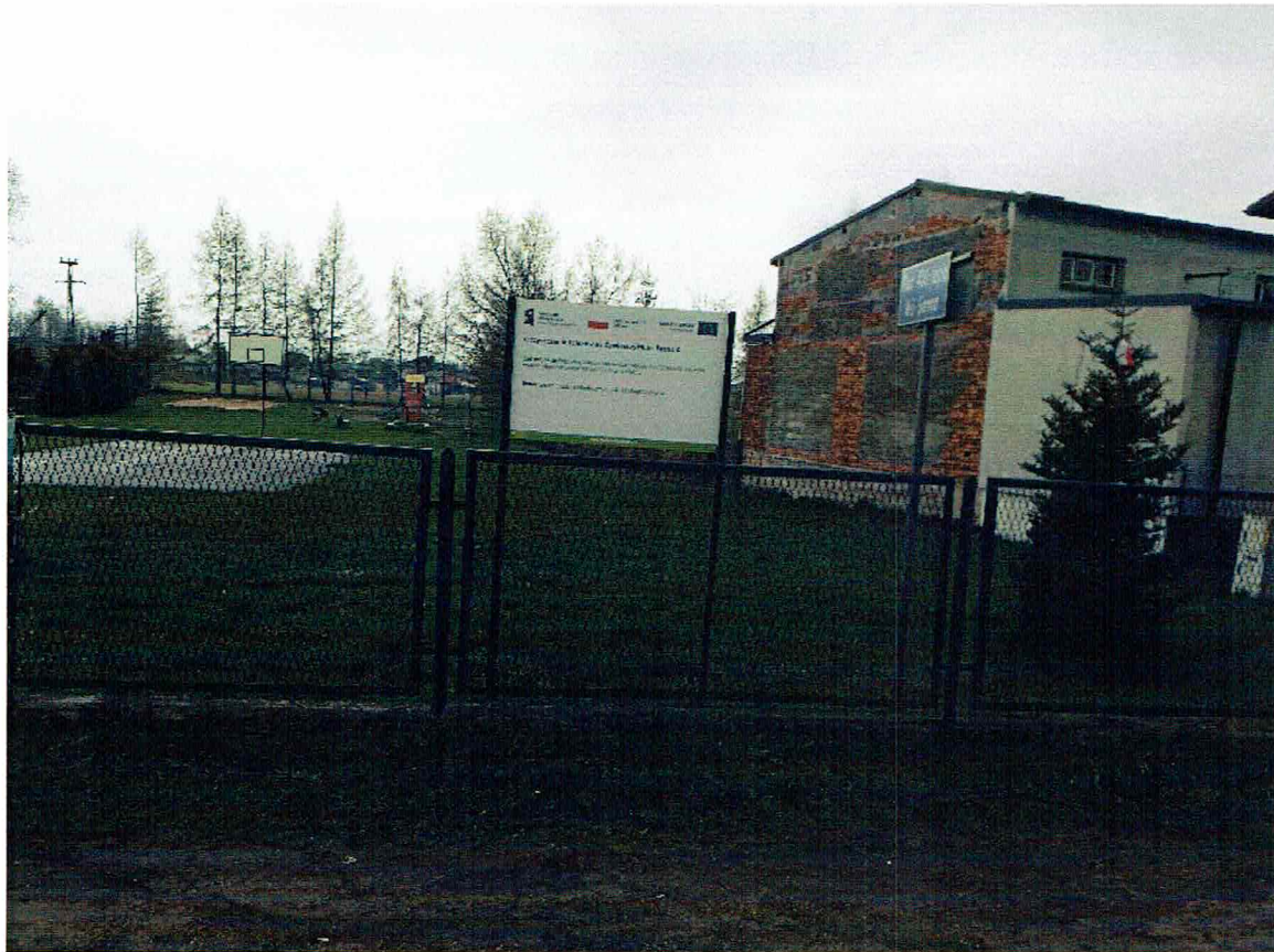
Tablica nr 1 Plac 400-lecia m. Sienna